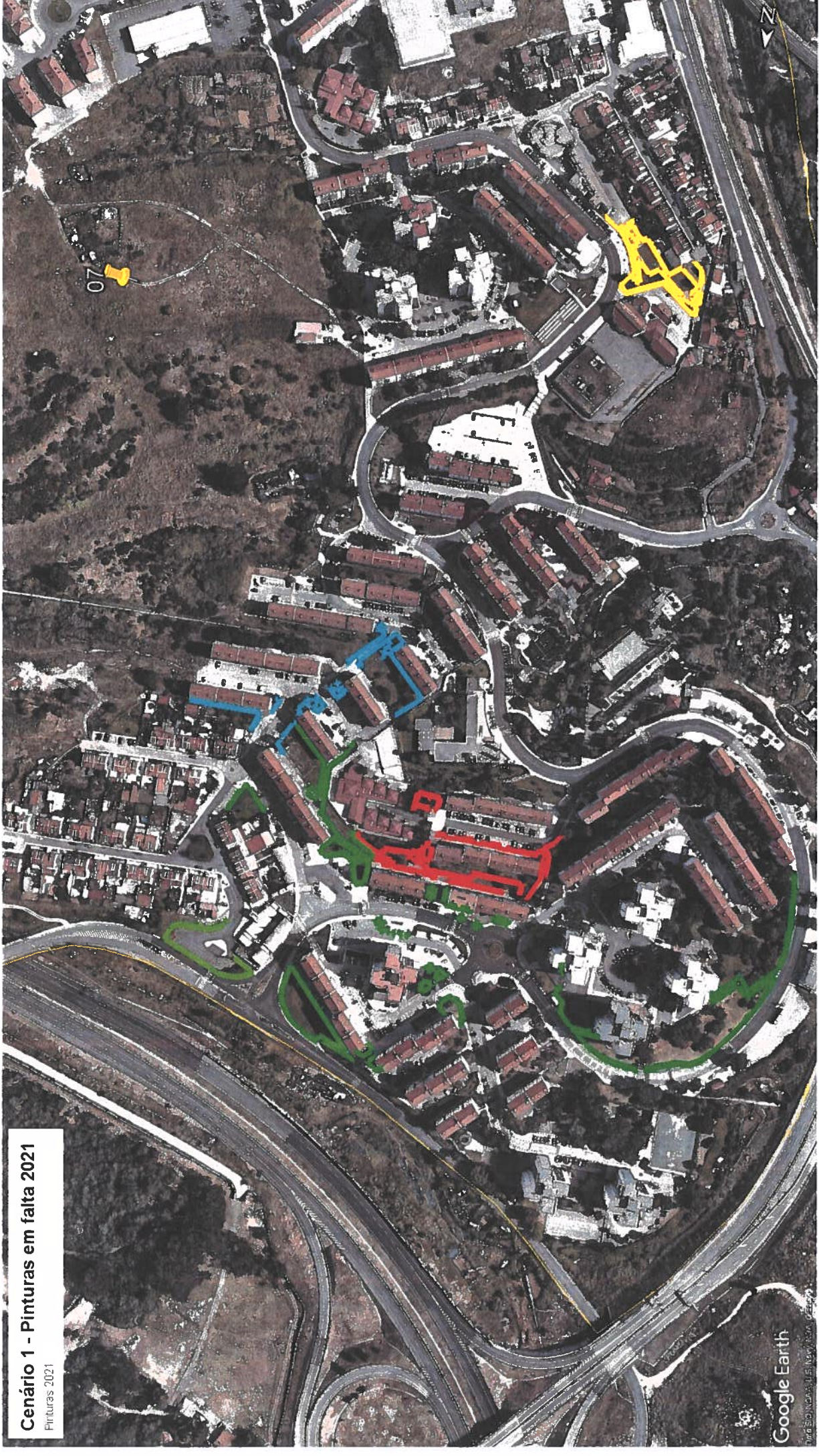
Cenário 1 - Pinturas em falta 2021 Pinturas 2021