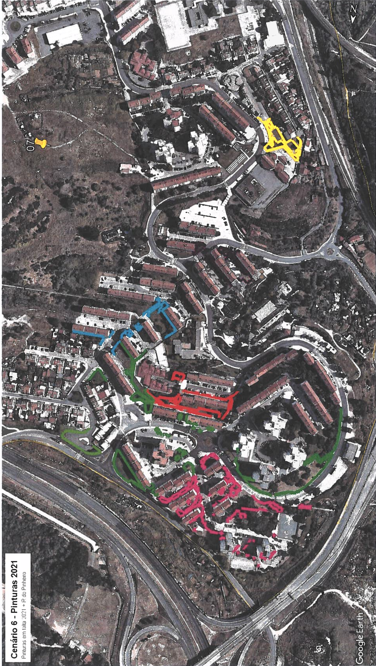
Cenário 6 - Pinturas 2021 Pinturas em talha 2021 + P. do Pinheiro