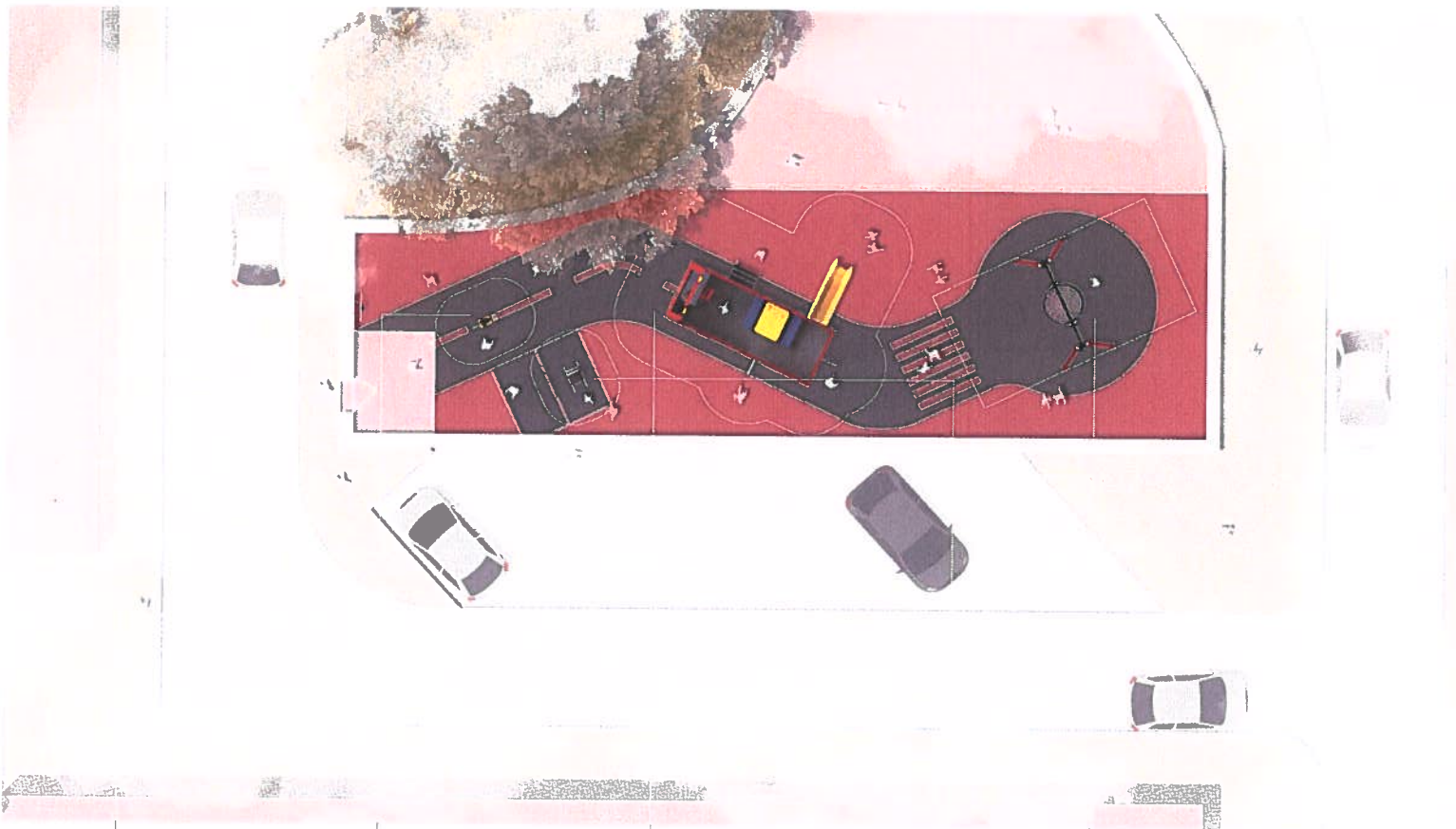
PAINEL INFO. JR 54 AL

GPS: 38.77456E, -9.2965991 - trackball: Google Earth